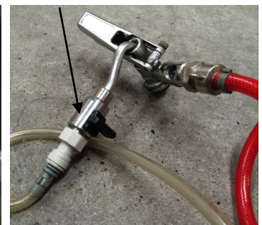
Afb. 2. Heineken koppeling